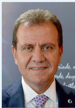
VAHAP SEÇER MERSİN