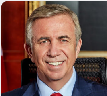
MANSUR YAVAŞ ANKARA