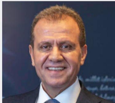
VAHAP SEÇER MERSİN