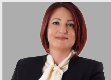
“İLKAY GİRGİN ERDOĞAN” Karaburun Belediye Başkanı