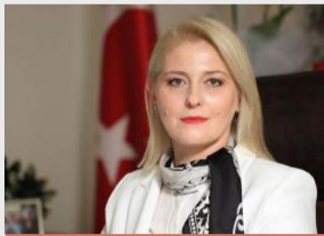
“ÖZLEM BECAN” Uzunköprü Belediye Başkanı