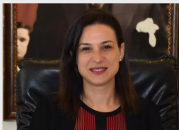
“FİLİZ CERİTOĞLU SENGEL” Selçuk Belediye Başkanı