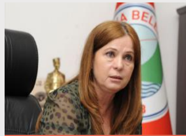
“FATMA ÇALKAYA” Balçova Belediye Başkanı