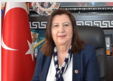
“ZEHRA ÖZYOL” Amasya Gümüşhacıköy Belediye Başkanı