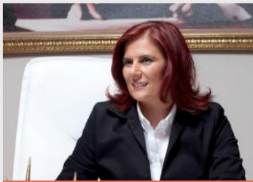
“ÖZLEM ÇERÇİOĞLU” Aydın Büyükşehir Belediye Başkanı