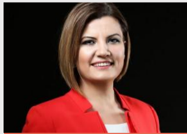
“FATMA KAPLAN HÜRRIYET” İzmit Belediye Başkanı