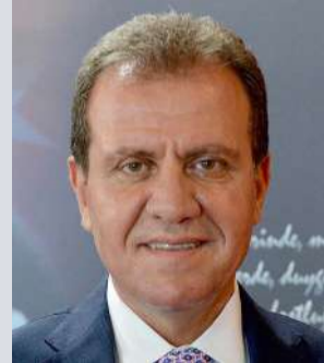
VAHAP SEÇER MERSİN