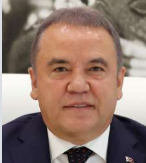
MUHİTTİN BÖCEK ANTALYA