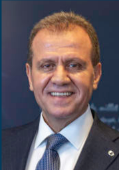
VAHAP SEÇER MERSİN