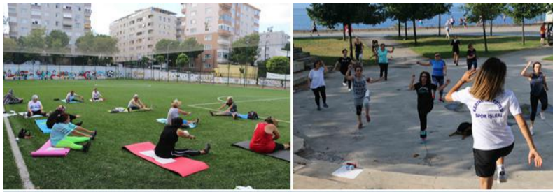
KARTALLILAR HAFTA SONU SPOR YAPIYOR