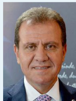
VAHAP SEÇER MERSİN