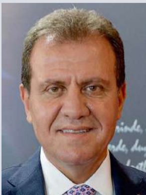
VAHAP SEÇER MERSİN