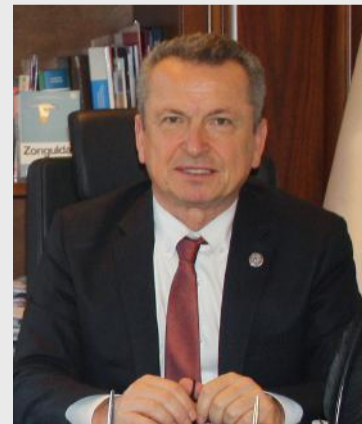
“BÜLENT KANTARCI” Zonguldak-Çaycuma Belediye Başkanı

“Bu dönemde toplum sağlığını korumak çok önemli”