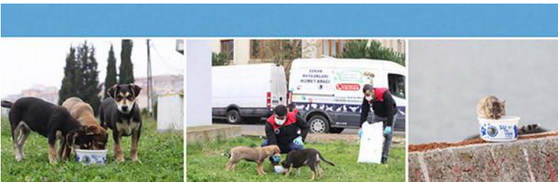
KARTAL BELEDİYESİ SOKAĞA ÇIKMA YASAĞINDA DA SOKAK HAYVANLARININ YANINDA