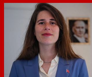
LÂL DENİZLİ İzmir-Çeşme