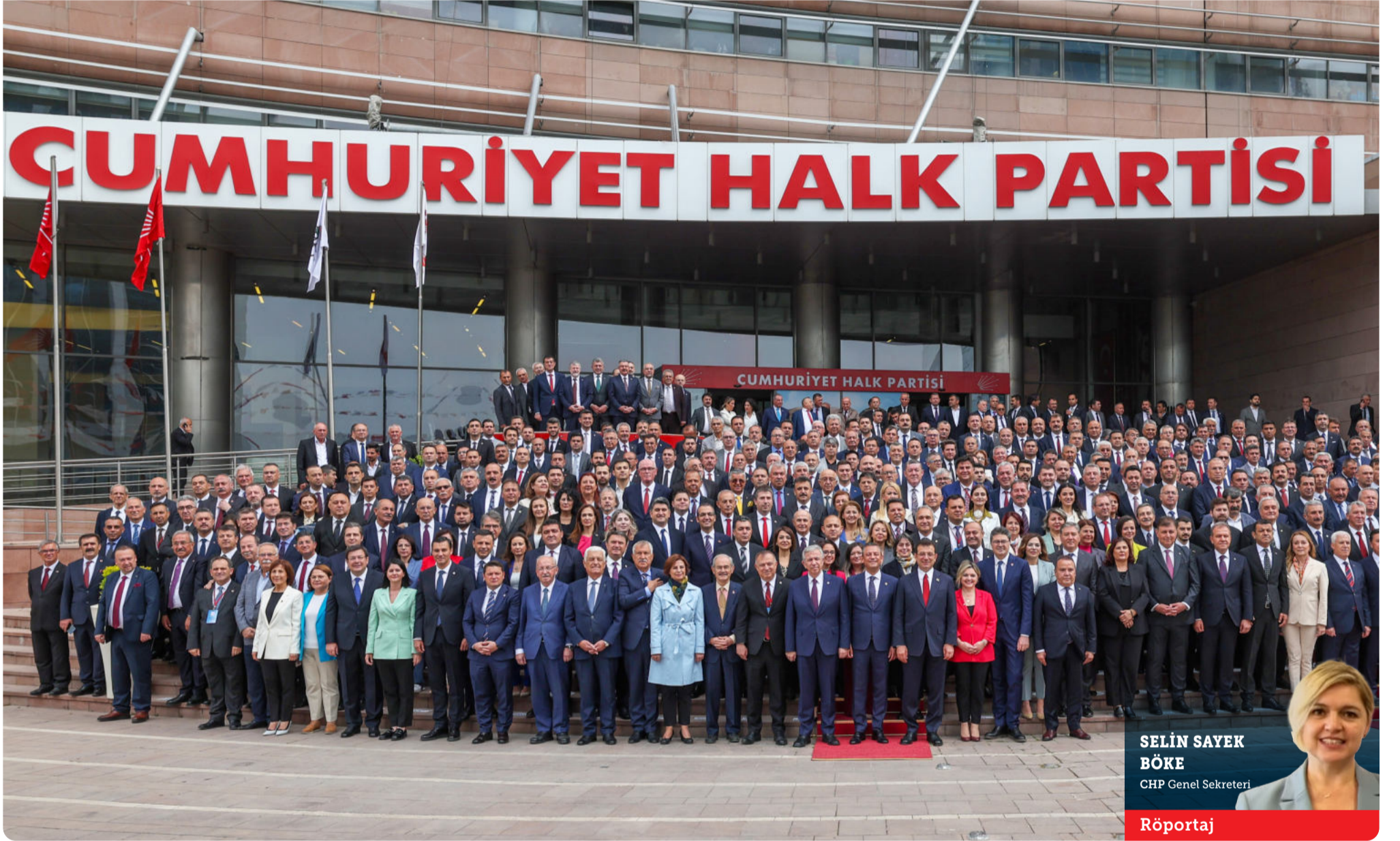
SELİN SAYEK BÖKE CHP Genel Sekreteri